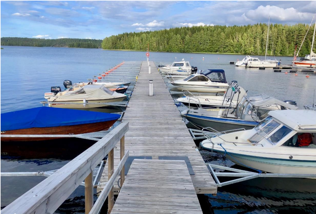
A-laiturin vasemmanpuoleinen laita muuttuu kylkipaikoiksi tälle kaudelle.

Huhtikuun lämpöaalto on sulattanut jäät ennätysvauhtia, ja veneilykausi on saanut varaslähdön. Matala vedenpinta on teettänyt ylimääräistä huoltotyötä satamassa, mutta satama pyritään saamaan käyttökuntoon vapuksi, reilun viikon suunniteltua aikaisemmin.